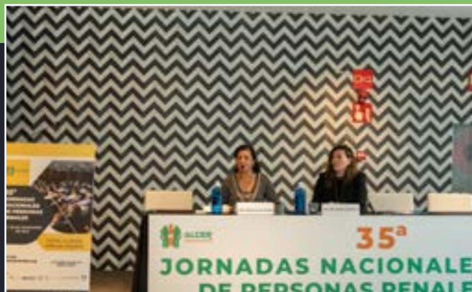
El bienestar del paciente: más allá de los objetivos numéricos

Si no pudiste seguir las Jornadas Nacionales en directo, puedes hacerlo a través de nuestro canal de YouTube ALCERTV