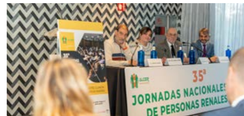
Calidad de vida pacientes con PaERC