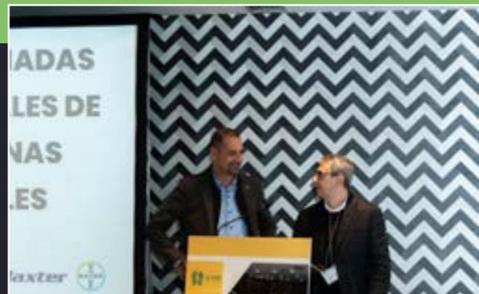
Proyecto "Ahora tu piel"