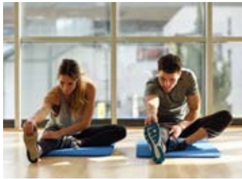
EJERCICIO FÍSICO Y CÁNCER DE RIÑÓN