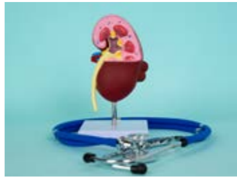
DÍA NACIONAL DEL TRASPLANTE