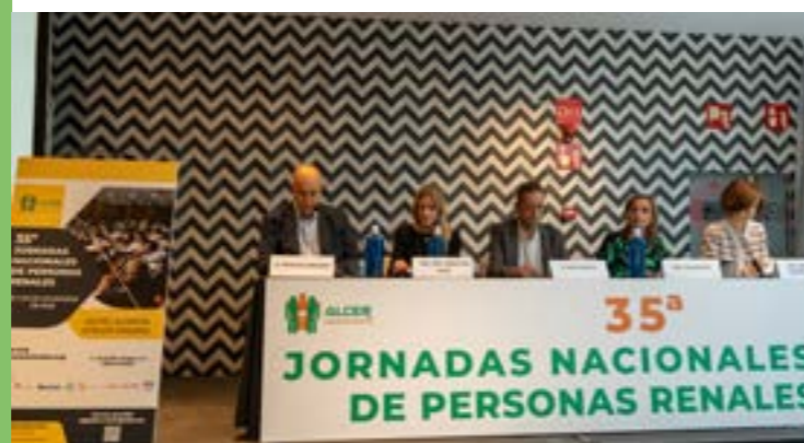
Educación sanitaria en el paciente diabético con enfermedad renal