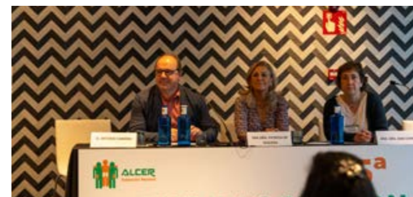
Retos de la atención de las personas con enfermedad renal crónica