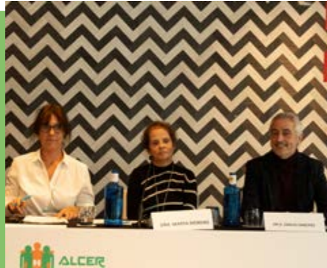
Covid-19 y enfermedad renal crónica