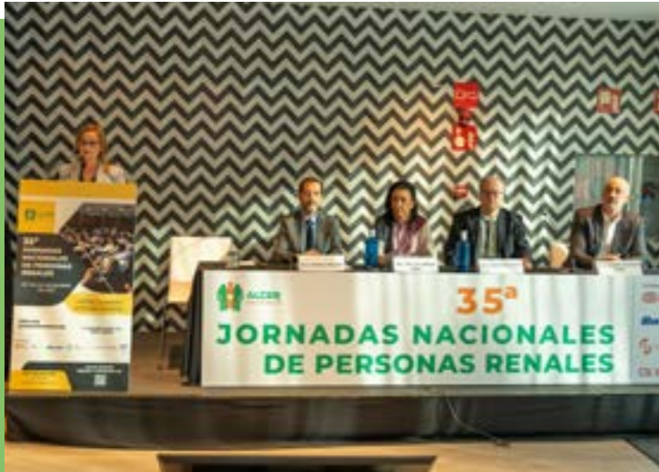
Avances en terapias domiciliarias