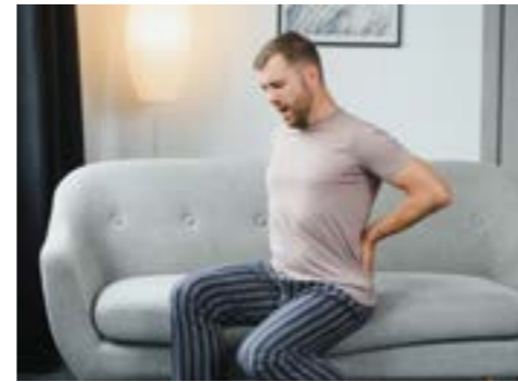
PIEDRAS EN EL RIÑÓN