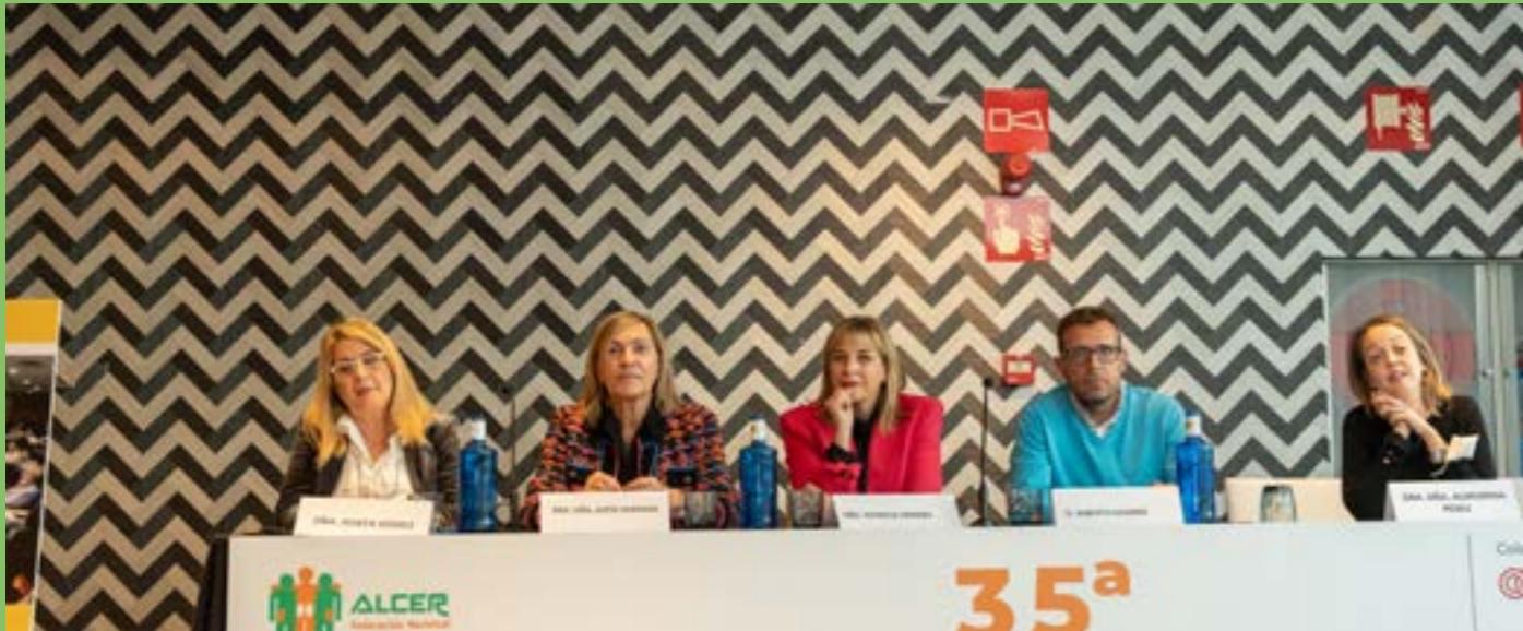
¿Qué nos preocupa a los pacientes?

Si no pudiste seguir las Jornadas Nacionales en directo, puedes hacerlo a través de nuestro canal de YouTube ALCERTV