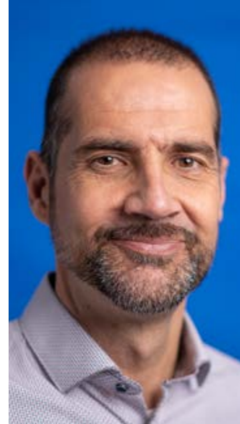
DANIEL GALLEGO ZURRO PRESIDENTE FEDERACIÓN NACIONAL AL CER

Comenzamos este año 2023 llenos de esperanza, convencidos de que este año por fin, no nos veremos tan afectados por la pandemia por COVID-19, aunque muy probablemente necesitaremos aún más dosis de refuerzo de vacunación, al ser nuestro colectivo de personas con enfermedad renal especialmente vulnerable y de riesgo. Sin duda, la mejor noticia es el afán de superación y todo lo que hemos aprendido durante la pandemia, pero manteniendo siempre las medidas sanitarias e higiénicas, con la vacunación como primera barrera frente a la COVID-19 y la GRIPE.