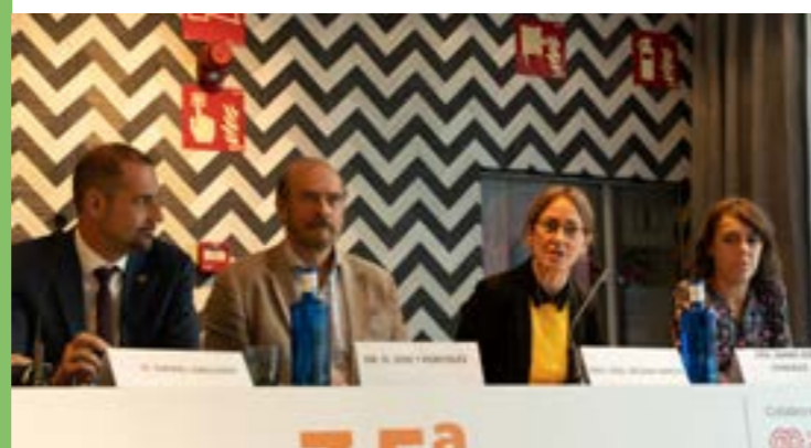
Afrontamiento integral de la anemia renal